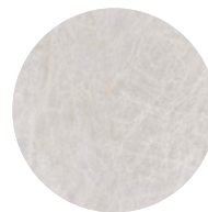
ABUJARDADO BUSH HAMMERED